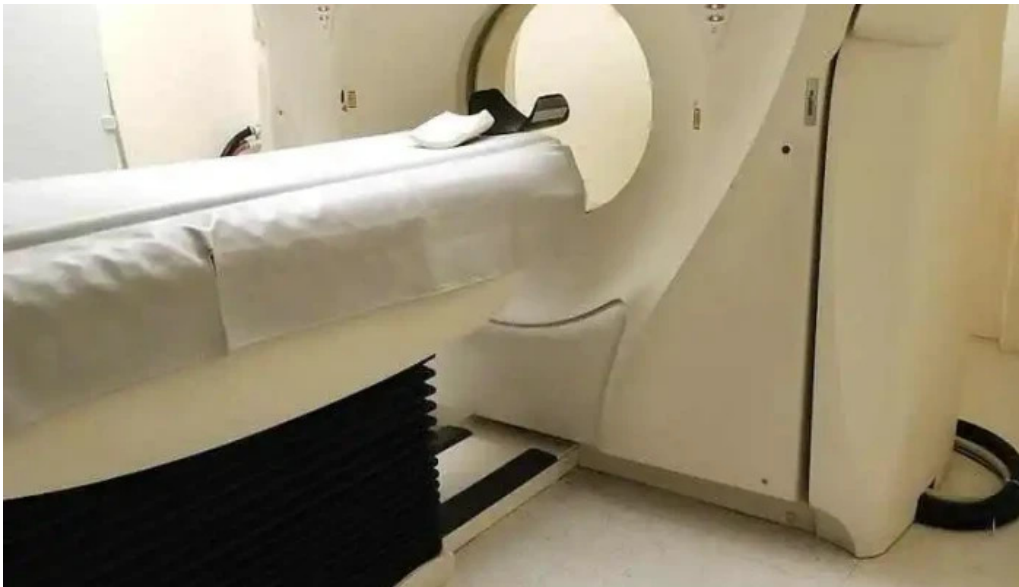
Consulta medica general ascension