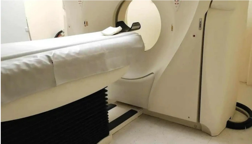
Consulta medica general comentarios