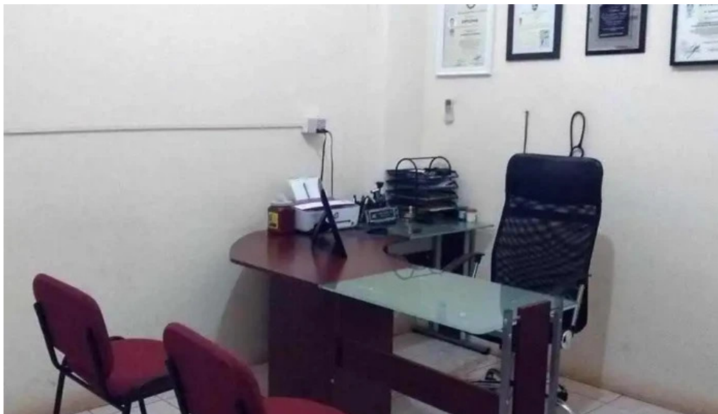
Clinica medica galenos del propietario