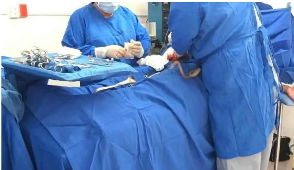
Clinica medica galenos videos