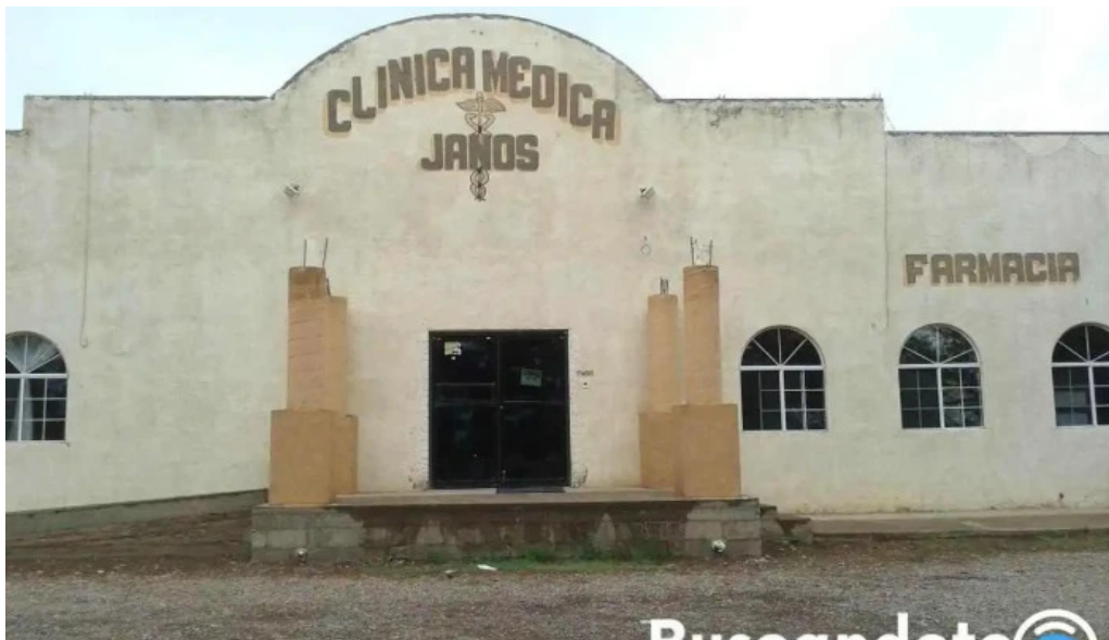
Clinica medica janos y farmacia janos