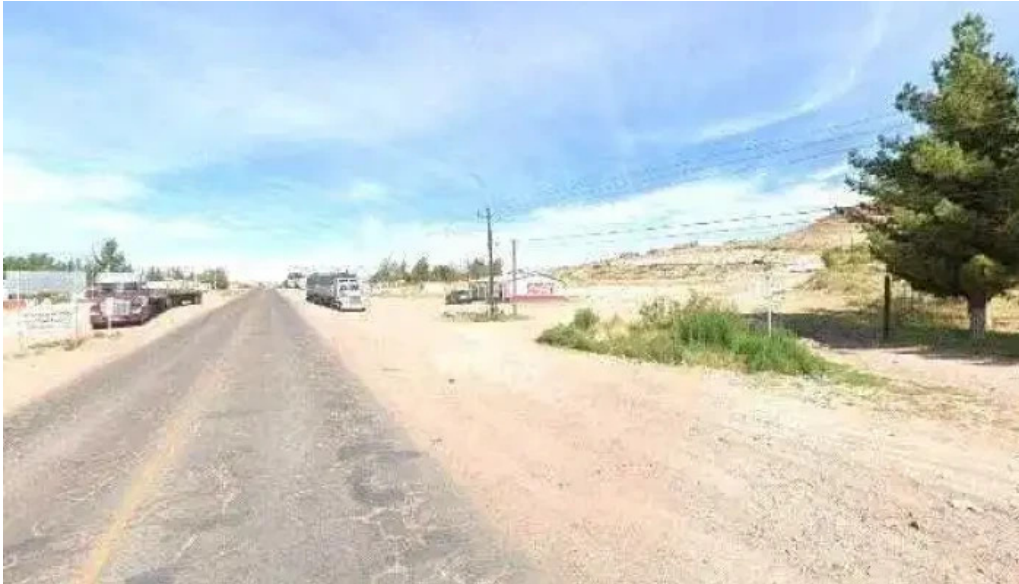
Clinica medica janos y farmacia como llegardeg