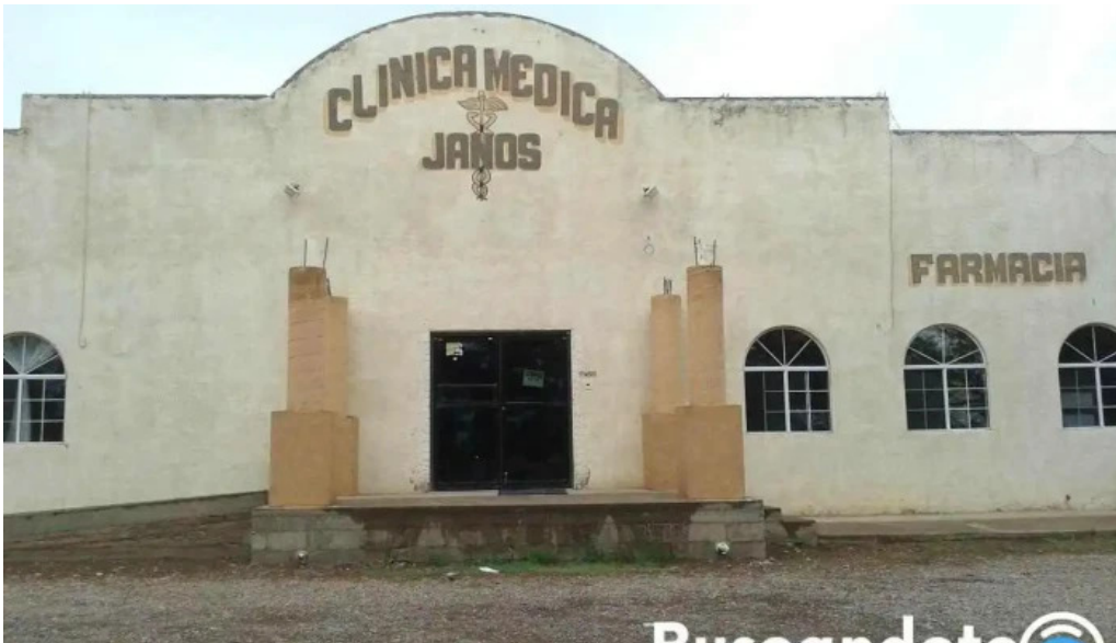
Clinica medica janos y farmacia como llegar